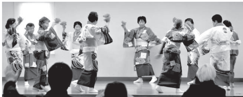
第2回淡路島まかせよ! まちづくり発表会 2019年3月9日

創紀は、若一王子熊野より五色の雲に乗り云々：延長五年の九二七年の延喜式に小社と認められ約一〇〇年明治初年の間志筑神社若一(やくいち) 権現である。この、おのころ島と聞いています。この地に、私は生れ育ました。 そして、津名高校卒業から七年間神戸の三菱電機に勤め、その後、淡路島のチベット(!) 一宮柳沢の古土井家の長子に嫁ぎました。淡路の田畑の里に生れ、柳沢の旧家に嫁ぎ、家の前庭から瀬戸内海や播磨、一宮郡家尾崎の家並み、東山寺の山並みを見渡せる絶好の山里です。言葉で現すなら景色バツグンのふるさと、山紫水明(さんしすいめい)、一目で千里観わたされる、一望(いちぼう) 千里(せんり)、花里(せんり)、花の春朝、月の秋の夕方美しいこと、花(か) 朝(あさ) (ちよう) 月夕(げつせき)、特に春の景色、桃 (とう) 紅(こう) 柳(りゅう) 緑(りょく) 晴れても雨でも良しの、晴(せい) 好雨(こうう) 奇(き) 穏やか(おんやか) なる地、五風十雨(ごふうじゅうう) そのものジャストの地です。あの人から教わりました。 夕陽の美しい瀬戸内海や小豆島、家島群島を柳沢丘高地から見渡せる風景は、今も飽きません。一度お越しください。 小学校は、中田小学校、生家から3kmあります。行はヨイヨイ、帰りは、同級生男五名女五名の楽しい連 この年でも農業を旦那と二人で三町歩お米四〇〇俵、玉ねぎの生産、牛八頭を飼い、毎朝四〜五時起きで牛の餌刈り、草刈機を背負い頑張ることが出ています。昼間は、得意な経理業務や、生命保険会社の保険勧誘に勤め二十八年最後は参与でやってきました。知合の淡路島の病院の資金確保、経理で旦那と役員もして一〇〇床事業拡大に参画させて戴きました。自宅に帰り、夕方は、お酒が大好きで一日の