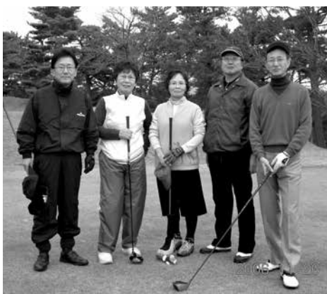
好きなゴルフ 2006年11月26日 (淡路カントリークラブにて15回生と)

今回のチャレンジ、津名高校卒業生の一人として、阪神支部報をお借りして淡路島や、淡路市一宮柳沢、農業や生活・働きを通じて、淡路島の魅力と私をお伝えします。人生・楽天に日頃思うことは、我が家の後