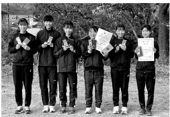
女子陸上競技部 県大会3位で近畿大会出場決定

しかし、そんな時に限って怪我を出来るとは思いませんでした。新型コロナウイルスの折、「かかりつけ医」云々があった時、皆無なのは不運かと恨みの気持ちが生じた程で、三人目出産以来、病院へは骨折や切り傷の「外科系」以外、殆どなかった事なく健康な現在です。亡き両親、ご先祖様にも感謝します。「もうすぐ行くから待っててね。」