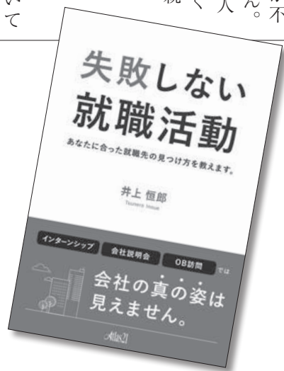
就活生向けの書籍

ります。しかし忍耐力のない若者が増えたわけではありません。多くの学生は独力で就活をおこなっており、その結果、社風や仕事の内容が自分の性質に合わず退職に至ってしまうのがほとんどです。 企業としても採用のミスマッチを起こしたくありませんが、数回の面接と、筆記試験だけで判断するのは至難の業です。私自身、何と多くの採用ミスをおかしてきたことか。 実社会の経験がない学生が自分に合った会社を選ぶには、周囲の大人のサポートが不可欠です。ところが多くの大学や親は放任しておられます。これでは学生が不憫でなりません。少なくとも本人や実社会をよく知っている、親兄弟は積極的に絡む必要があると思います。 私には4人の子供がいます。が、本人に向いてる仕事や会社、さらに出世の可能性までいたい分かります。そこで私と同じ轍を踏ませない様に彼らの就活をサポートしました。長男は大手にもありましたが、出身大学の銘柄からして、入社しても思い通りの出世は望めそうにありません。そこで将来有望な中堅企業を勧めました。その助言に従った彼は34才で執行役員になり、今やその企業は一部上場企業になっています。長女と次女も私の指南によって上手くいきました。ところが三女だけは私の言う事を聞こうとしません。住宅メーカーの営業職に就職したものの、厳しい職場環境についていけず、1年足らずで退職してしまいました。 このように就活を学生本人に任せっぱなしにしない事が大切なのです。私は、大学、親、学生本人の意識を変えたいと思います。首記の本を出版して就活生に一万冊以上配布しました。今は新入社員向けの著作を執筆しております。ビジネスライフの成否は入社後3年で決まると考えており、多くの若者に成功して欲しいと願っているからです。 最後に、皆様にも『失敗しない就職活動』を差し上げます。ご希望の方は『あとらす@stj.jp』まで、宛先に就職したものの、厳しい職場環境についていけず、1年足らずで退職してしまいました。