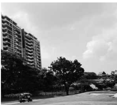
マレーシアでのコンドミニアムを望む

クアラルンプールの日本人会にはたくさんの方のサポート系、文化系のサークルがありセカンドホームの憩いの場となっています。コロナ前までは多くの人がサークル活動で賑わっておりましたが昨今のコロナ禍が増え寂しくなっています。公共のバス、モノレールを含め電車も整備されていますが、駅までの距離を徒歩で移動するのは困難です。バイクも多く、安全に移動するにはマイカーも欲しくはGrabbtaxiが移動に欠かせません。Grabはアプリで管