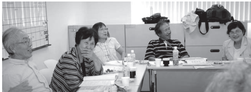
健康福祉・優游サロン (元気ジジイ・ババ会) 2012年7月9日 (関西看護医療大学市民室にて大学先生と15回生と)