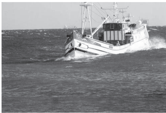
鮮魚を満載したなません