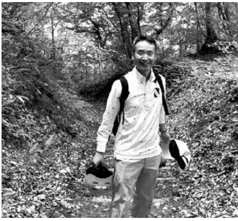
世界自然遺産 白神山地にて

最近ではテレワークが普及してきたとは言え、まだまだ会社社員には転勤、これに伴う単身赴任は付き物かと思えます。私の場合、関西電力で勤務した32年間のうち、福井県で4年、東京で2年の勤務がありました。が、それ以外は大阪または姫路での勤務であり自宅から通勤できました。が、一昨年57歳時に関西電力を退職し、縁あって(巡りあわせで)青森県の日本原燃(株)に転籍することにになりました。これまで単身赴任が少なかった分、「ここに来てドーンと来たな、会社員生活トータルでバランスが取れるように