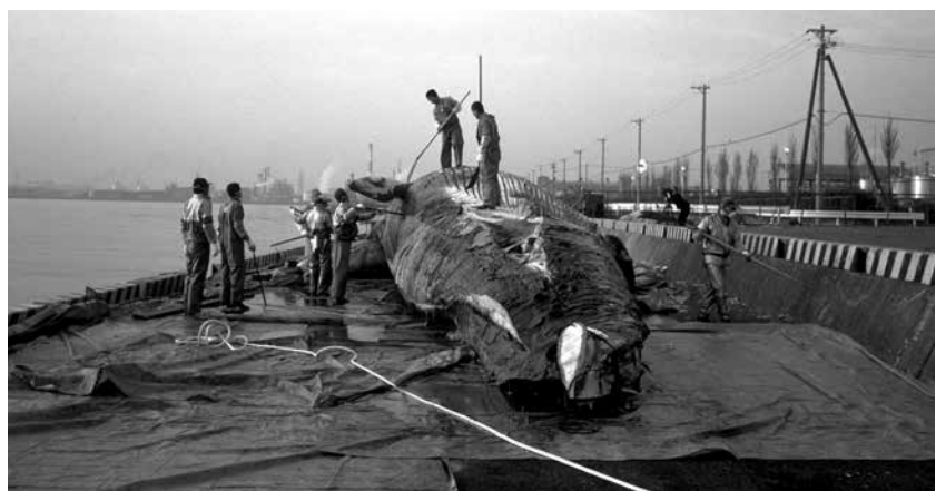
ナガスクジラの解剖

また市民と共に自然そのものを次世代に残すために努力する」といった考えをもって活動してきている。